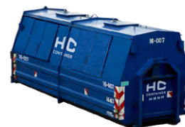
Ladcontainer Lukket 16m 3