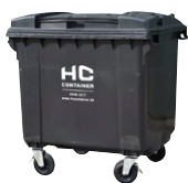
Minicontainer 120L - 240L - 660L 770L