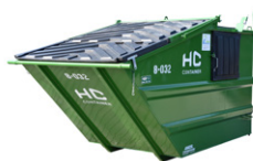
Vippecontainer 4,5m 3 - 6m 3