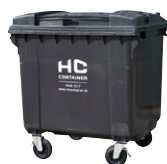
Minicontainer m. brevindkast og hængelås

Eksempler på bortskaffelse af dit affald